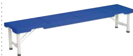
折たたみベンチ 背無/ブルー