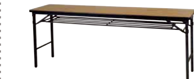
会議用机 チーク H700mm