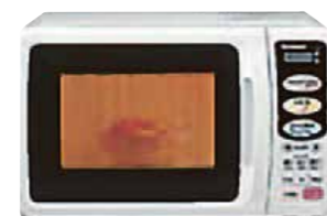
オープン電子レンジ