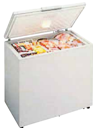
ホームフリーザー